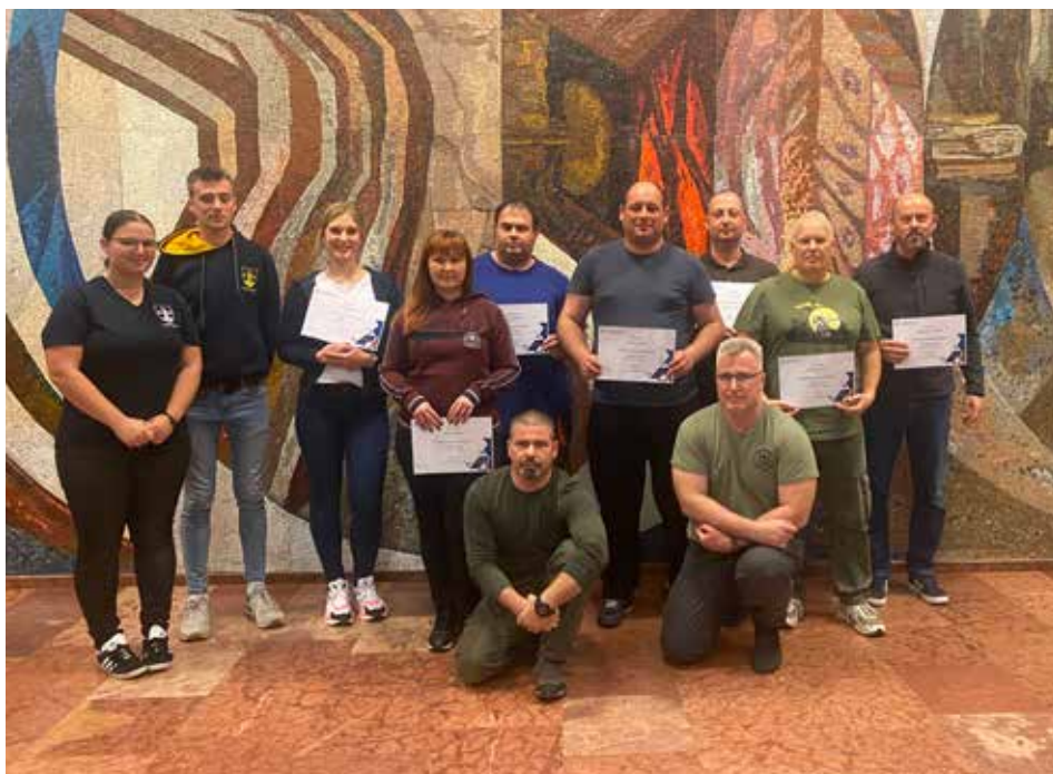
A véméndi önkéntesek a tanfolyam elvégzését igazoló oklevelekkel