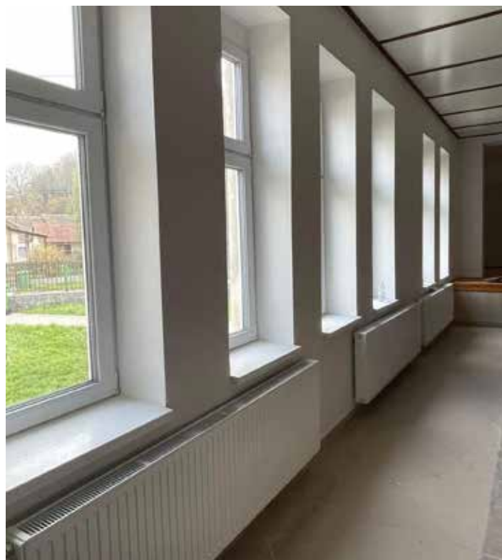
Az épület új, jó hőszigetelést biztosító ablakokat kapott

– Az új kútból vett minta magas vastartalmat mutatott – közölte a polgármester. – Ez azt vonja maga után, hogy vastalanító berendezésre van szükségünk, de ez a készülék meglehetősen drága. Ezért az illetékes minisztériumhoz fordultunk támogatásért, jelenleg várjuk a remélhetőleg kedvező választ. Bízunk benne, hogy tavaszra előrelépést érünk el ezen a téren is.