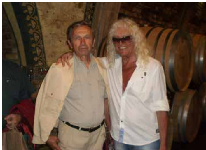
Kóbor János 70. születésnapján gyermekkori bátaszéki barátjával, focista csapatbeli társával, Nagy Ferenc nyugalmazott körjegyzővel

korát a Sóház utcai nagyszülői házban. Amióta Mecky a magyar és a nemzetközi zenei élet meghatározó alakja lett, mi bátaszékiek mindig büszkén dicsekedtünk azzal, hogy az Omega frontembere bátaszéki származású, de ő is szívesen beszélt a Bátaszéken töltött gyermekkoráról. Sokszor beszélt arról, hogy az építészeti iránti érdeklődését apai nagyapjának köszönhette, talán ezért is indult el a mérnöki pályán és szerzett diplomát, bár egy percet sem dolgozott mérnökként, mert elrabolta a zene. Mesélt arról is, hogy itt alakult ki benne a természet iránti szeretet, mert átélhette a falusi életet a maga egyszerűségével és emberi kapcsolataival. Szívesen anekdotázott a gyerekkori haverokkal megélt élményekről, a focimeccsekről, ahogy a „szöges cipők” kopogtak, amikor a csapat a kocsmá mellett a tölzöböl levonult a macskaköves úton a pályára, a sárvízi pecázásokról, a nagy csatangolásokról a határban. (...) Sajnos a középiskolás éveitől, a zenei karrier berobbanása után már ritkábbá váltak a bátaszéki látogatások, de nem szűnt meg szívében bátaszékieknek maradni. Ezt a kötődést városunk néhány éve, születésnapja alkalmából átadott Pro Urbe Bátaszék kitüntetéssel köszönte meg. (...) Az gondolom, hogy Kóbor János, Mecky nagyon sokáig fog élni a szívünkben, mert embersége, zenei munkássága, életműve olyan volt, amire még nagyon sokáig fogunk emlékezni mi is ugyanúgy, mint a zenét szerető világ.