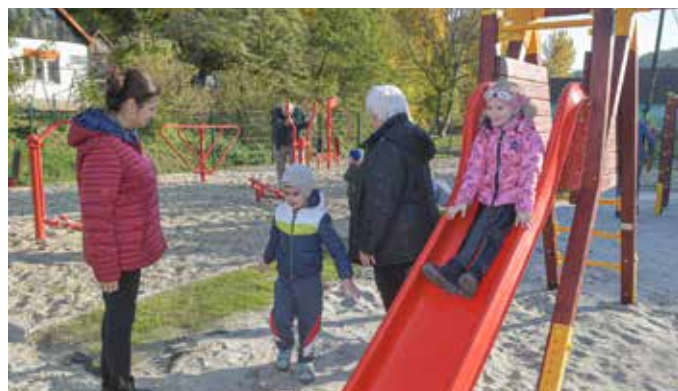
A legkisebbek rögtön ki is próbálták a park játékeit

BÁTAAPÁTI Önkormányzati célkitűzés Bataapátiban minél több felnőtt helybelit megnyerni a sport, az egészséges életmód számára. Ennek a célkitűzésnek a jegyében gyarapodott a település a közelmúltban egy kültéri fitnessparkkal és játszótérrel.