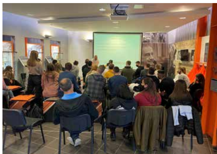
Élő fizikashow, ez alkalommal a hatásfok témakörben

A videós tartalmak azonban nem merülnek ki a fizikakíséreltekben, egy további lejátszási listába rendezve például az AEM egyik sorozat-