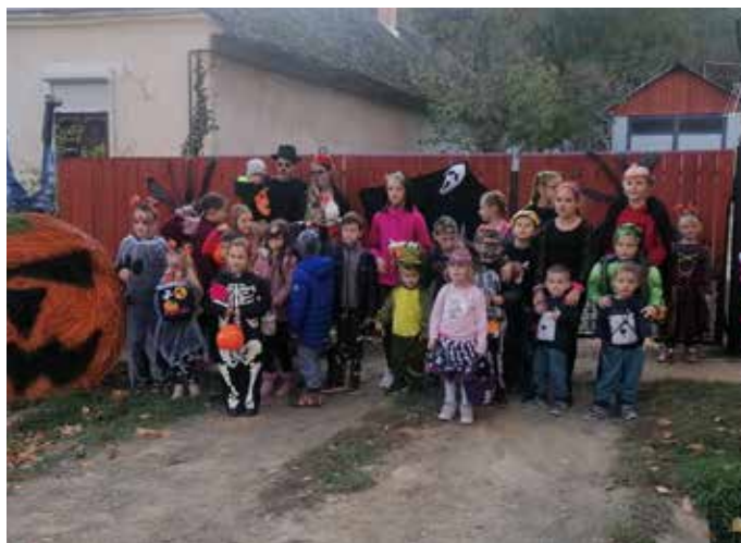
Időnként egy kis pihenőt tartott a felvonuló csapat, mindenütt szívesen látták őket

MŐCSÉNY Első alkalommal zajlott le Mőcsény történetében halloweeni séta. A különleges esemény október 30-án, szombaton borzongatta, illetve szórakoztatta a hálás nézőközönséget.