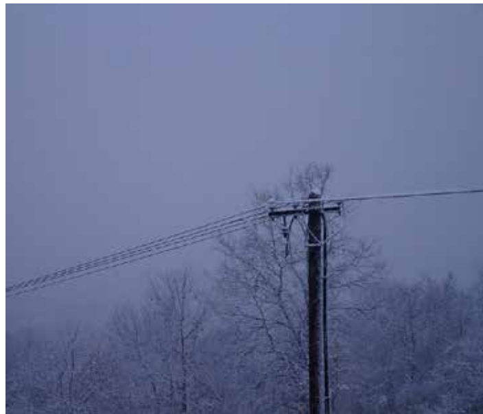
Az importnak köszönhető, hogy mindenhol volt áram

Gondoljunk bele, mi történne, ha az immár folyamatosan fennálló kapacitáshiányos helyzetben bármilyen műszaki, gazdasági vagy egyéb okból kifolyólag nem állna rendelkezésre megfelelő mennyiségű import? A válasz fenyegető: felkészülhetnénk az áramkorlátozó-sokra!