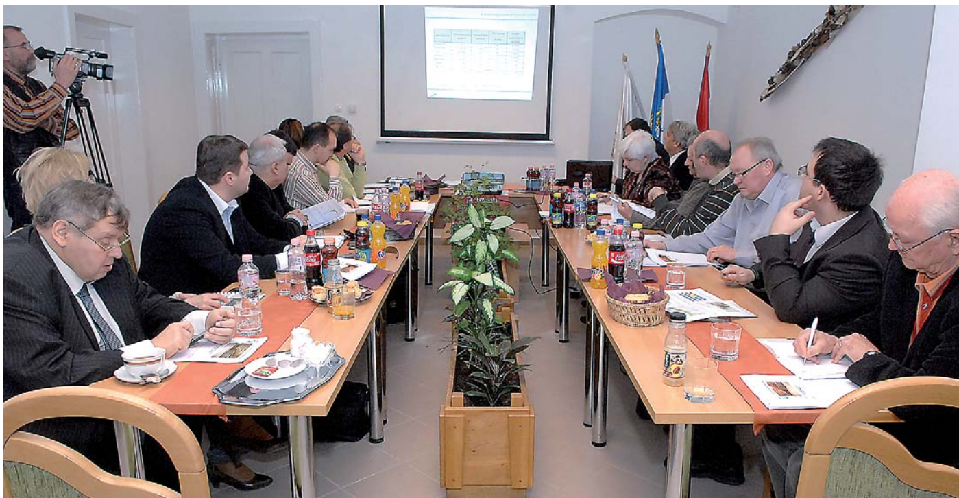
Részletes tájékoztatót kaptak a TETT-ülésen megjelentek az RHK Kft. által kezdeményezett közvélemény-kutatás eredményeiről

SZONDA Pozitív kép rajzolódik ki a kutatás végeredménye