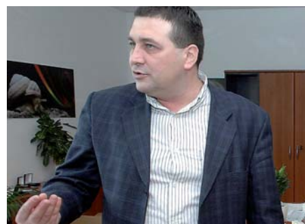
Új fázisához ér az NRHT 8. OLDAL