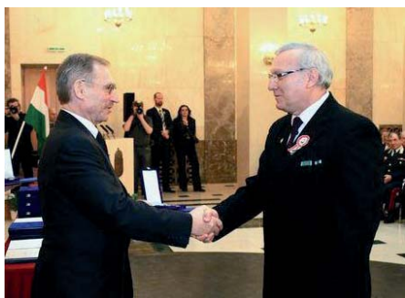
Minisztériumi díjat kapott a jegyző 2. OLDAL