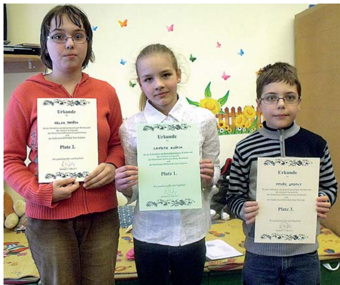
A szépkiejtési verseny 5-6. osztályos díjazott ifjú tehetségei