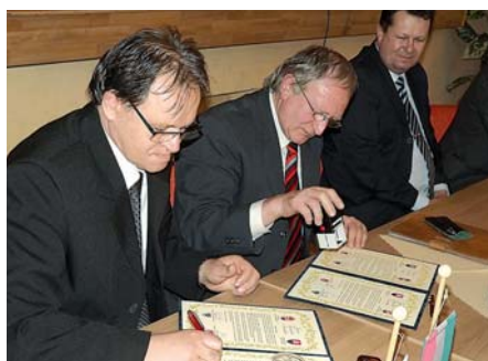
Testvértelepülési megállapodás 6. OLDAL