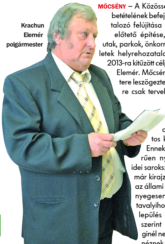
Krachun Elemér polgármester

MŐCSÉNY – A Községi Ház rendbetételének befejezése, a ravatalozó felújítása és hozzá egy előtető építése, a közösségi utak, parkok, önkormányzati épületek helyrehozatala – sorolta a 2013-ra kitűzött céljait Krachun Elemér. Mőcsény polgármestere leszögezte, ezek egyelőre csak tervek, hiszen még nem állították össze és fogadták el a község pontos költségvetését. Ennek ellenére keserűen nyilatkozott az idei sarokszámáról, amely már kirajzolódni látszik: az állami támogatás lényegesen kevesebb a tavalyihoz képest. A település első embere szerint minden eddiginél nehezebb évnek néznek elébe.