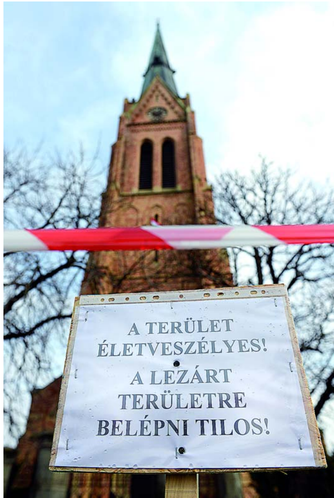
Hamarosan ismét a templomban tarthatják a miséket