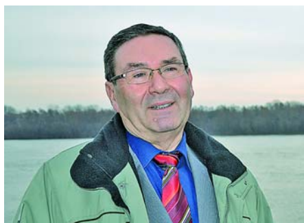
Az új év új életet hozott számára 2. OLDAL