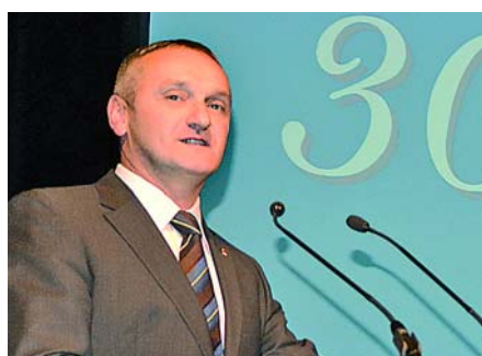
Jövője is van az 1. blokknak 6. OLDAL