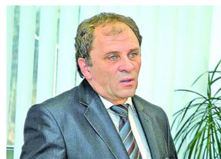
Új módszert dolgoztak ki 8. OLDAL