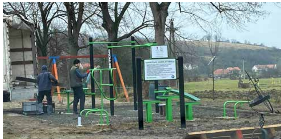
A Sportpark kialakítása november közepén kezdődött el

Ugyancsak helyi hír, hogy útjára indult az Adventi díszben Ófalu házai elnevezésű kezdeményezés. Ennek keretében december elseje és 24-e között az arra kedvet érő lakosok, megjelölve egy nekik megfelelő dátumot, feldíszítik házuk ablakát, ajtaját, udvarát vagy kertjét. Az így elkészített mű egy-egy fotó révén felkerül a települési FB oldalra. Az élő adventi kalendárium különleges, színes, csillogó látvánnyal teremt egyedi hangulatot a közösségi portálon. Mindezt tetézi, hogy az érdeklődők valamennyi kalendáriumi lapon egy-egy odaillő verset is olvashatnak.