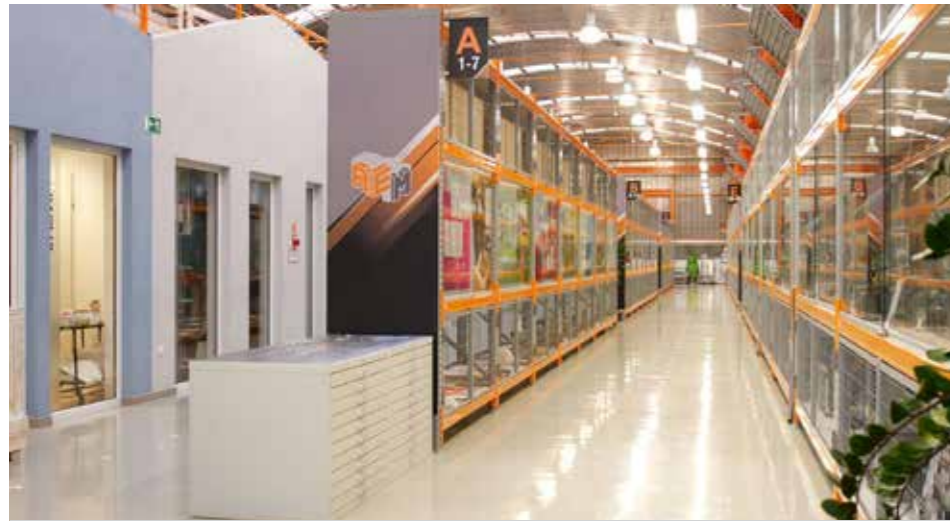
Az Atomenergetikai Múzeum már márciusban megkezdte a saját csodaországának újratervezését

PAKS Az új évtized új kalandokat is tartogatott. Számos olyan mémet lehetett látni az internet különböző zégugaiban 2020 során, ahol a Jumanji társasjáték egyes állomásaihoz hasonlították az év egyes hónapjait. A humoros képeken túl egy biztos, sokszor tényleg olyan érzésünk lehetett az év folyamán, hogy valami teljesen abszurd, eddig csak filmekből ismert világba csöppentünk az új évtizeddel. Az Atomenergetikai Múzeum (AEM) már márciusban megkezdte a saját csodaországának újratervezését – a kétezer négyzetméteres kiállítóteréből a különböző online platformokra. Panorámaképekkel biztosította, hogy otthonról az okoseszközök segítségével körbe lehessen nézni a múzeum kiállítóterében, továbbá Sketchfab-moделlek segítségével az egyes műtárgyakat kiterjesztettség-tartalomként is megismerhették az érdeklődők egész évben az atomerőmű hivatalos Facebook-oldalán.