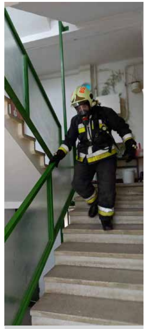
Lépcsőfutás a bátaszéki tűzoltó laktanyában