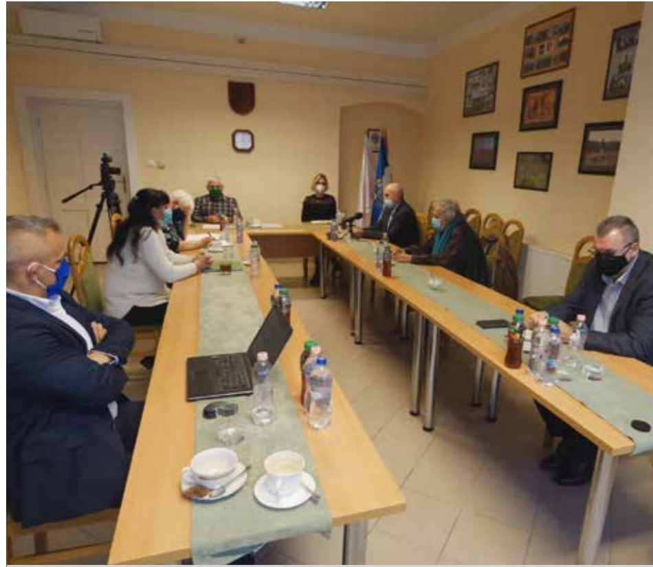
A tanácskozásnak a bátaapáti község háza adott otthont

fenntartásához szükség van a személyes jelenlétre úgy a települések vezetőivel, mint a települések lakóival.