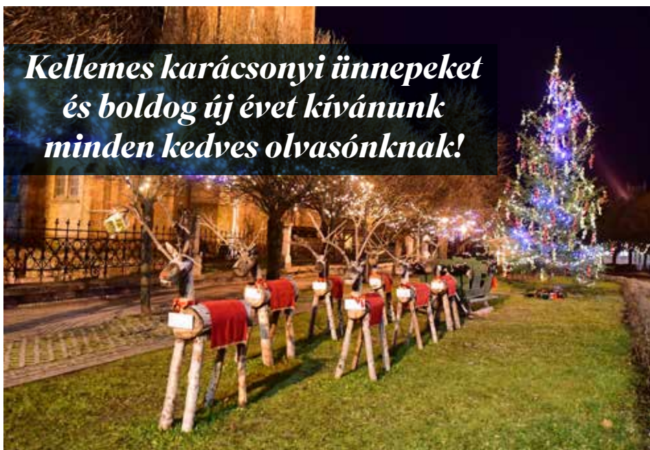
Bátaszék karácsonyfája ünnepi díszkivilágításban

Kellemes karácsonyi ünnepeket és boldog új évet kívánunk minden kedves olvasónknak!