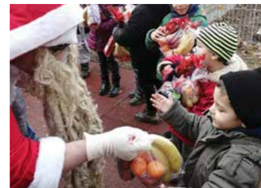
Volt a csomagban minden jó, piros alma, magyoro...