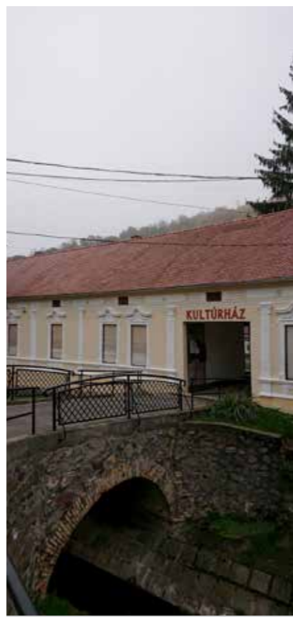
Az épület kívülről már tetszetős

Melyen azonban még lenne munka, ha kívül nem is, belül annál inkább. Ugyancsak rendbehoztatalra vár a nagyterem, a vizesblokk és az udvarra is ráférne egy alapos rendezés. A polgármester közölte, hogy jövőre ismét pályáznak, nem adják fel a teljes felújítás mielőbb megvalósítandó tervét.