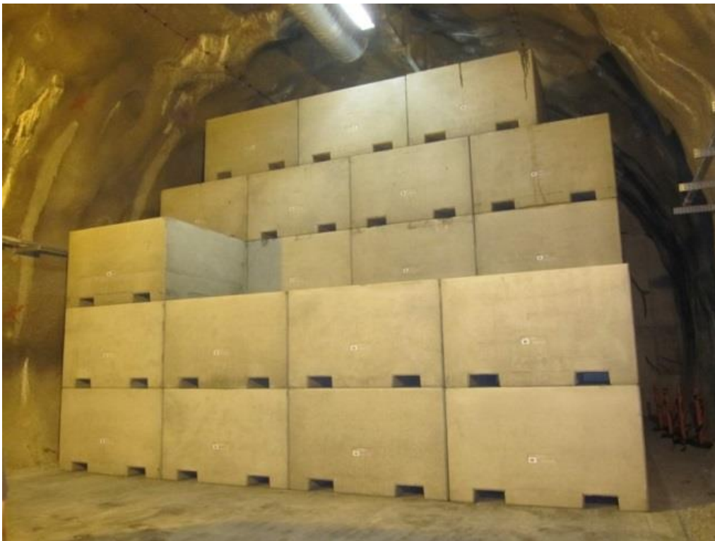
Az I-K1 kamrában elhelyezett betonkonténerek elrendezése

Az I-K1 tárolókamra fogadta a 9 db 200 l-es fémhordót tartalmazó vasbeton konténeres hulladékcsomagokat. Az I-K2 tárolókamrában vasbeton medence került kialakításra, amelyben a kompakt hulladékcsomagokat és a tömörített hulladékot tartalmazó hordókat helyezik el. A medence tetejére két rétegben alacsonyabb aktivitás-koncentrációval rendelkező, tömörített hulladékot tartalmazó 200 l-es fémhordók kerülnek.